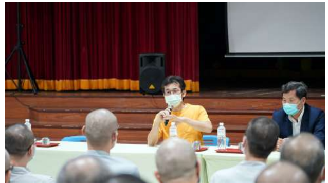
↑.魏德聖導演親臨臺中監獄與收容人座談