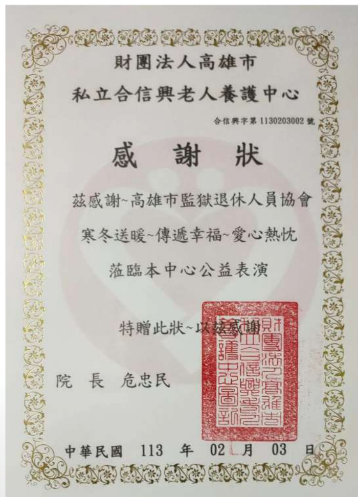
↑. 退休協會獲頒「寒冬送暖、傳遞幸福、愛心熱忱」感謝狀