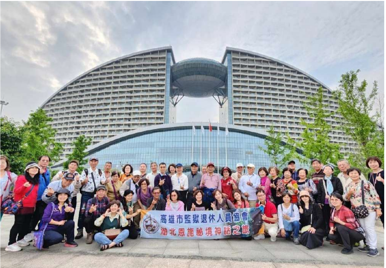
↑.洲際大酒店：長江河畔洲際大酒店前大合照

晚餐，在洲際酒店享用了精緻豐盛的自助餐。酒店餐廳陳設豪華氣氛佳，用餐座椅舒適，大家放鬆的喝著紅酒，享用美味佳餚，各式甜點水果應有盡有，一群人圍在餐桌上共享美食輕鬆用餐，感受六星級絕佳夜浪漫氛圍。