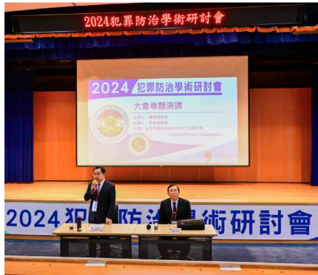
↑ . 邢泰釗總長演講