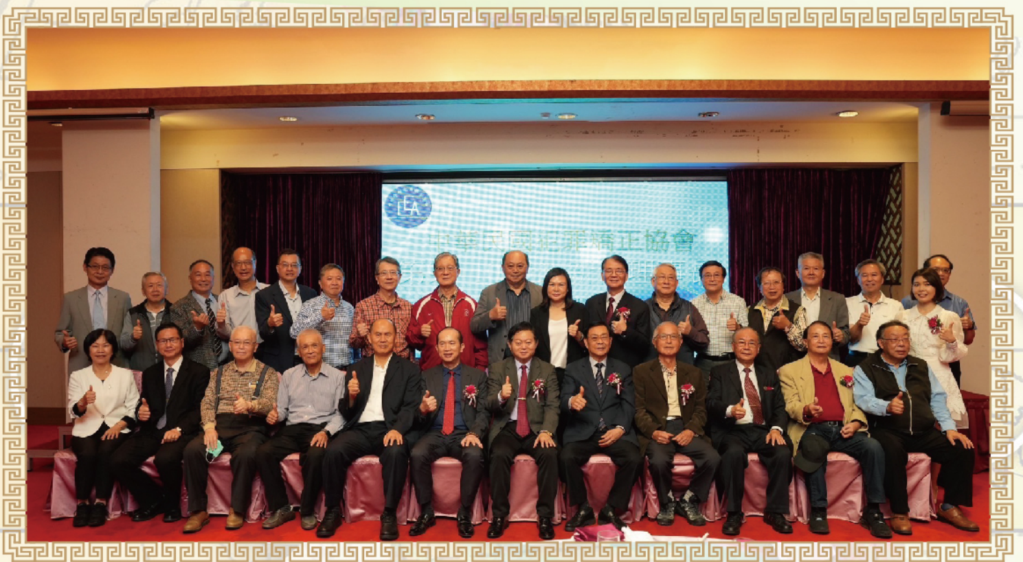
中華民國犯罪矯正協會全體理監事、顧問合影