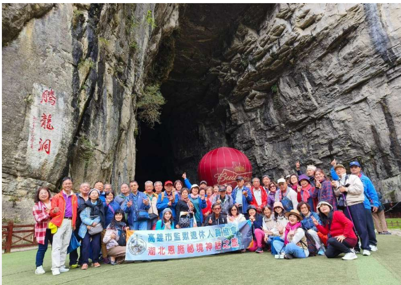
↑ . 龍騰洞：世界特級溶洞「利川騰龍洞」退休協會會員來此一遊

在騰龍洞風景區入口處，協會人員先拍了一張團體大合照。隨後，跟著導遊的解說經過了落水洞，見識到了奔湧的清江浮流景觀。在騰龍洞旱洞也見識到了，何謂能裝下 1 億人口，寬闊又深邃的山洞不見底。洞內步道潮濕，為了安全，大家互相叮嚀放慢腳步！