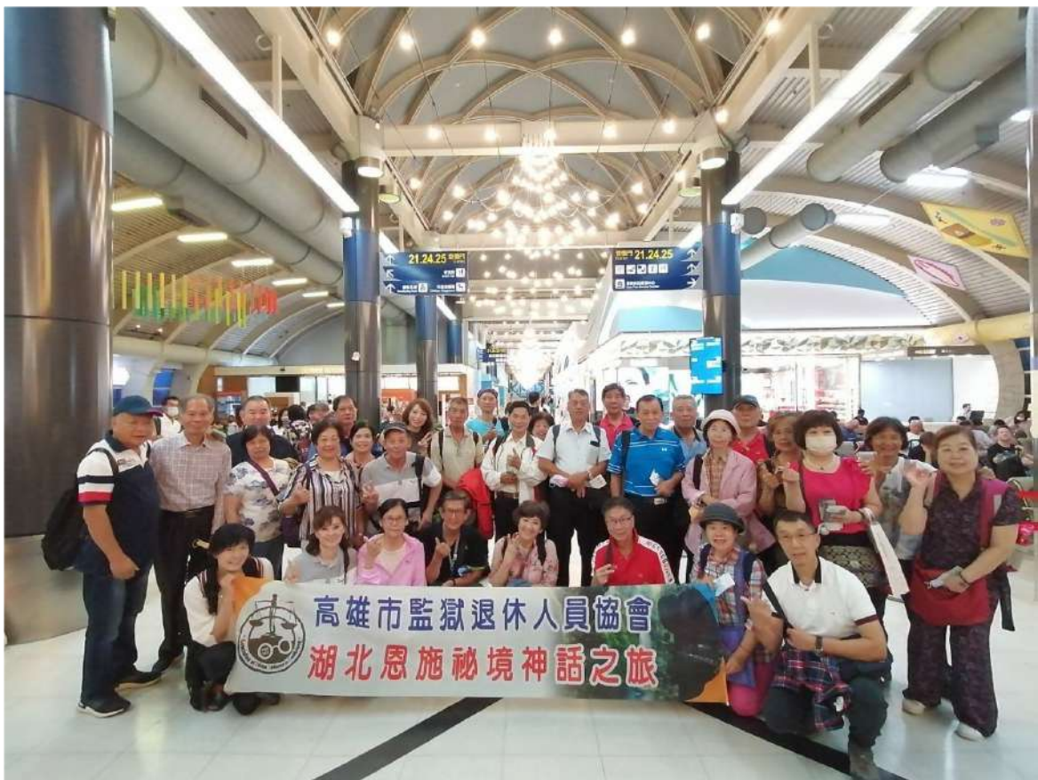
↑.出發前於高雄國際機場登機處大合照

113年4月19日 (星期五) 下午5點30分。薄暮時分，夕陽西下，一群來自「高雄市監獄退休協會」會員、顧問及眷屬50人，來到了高雄市小港國境機場出境處集合。