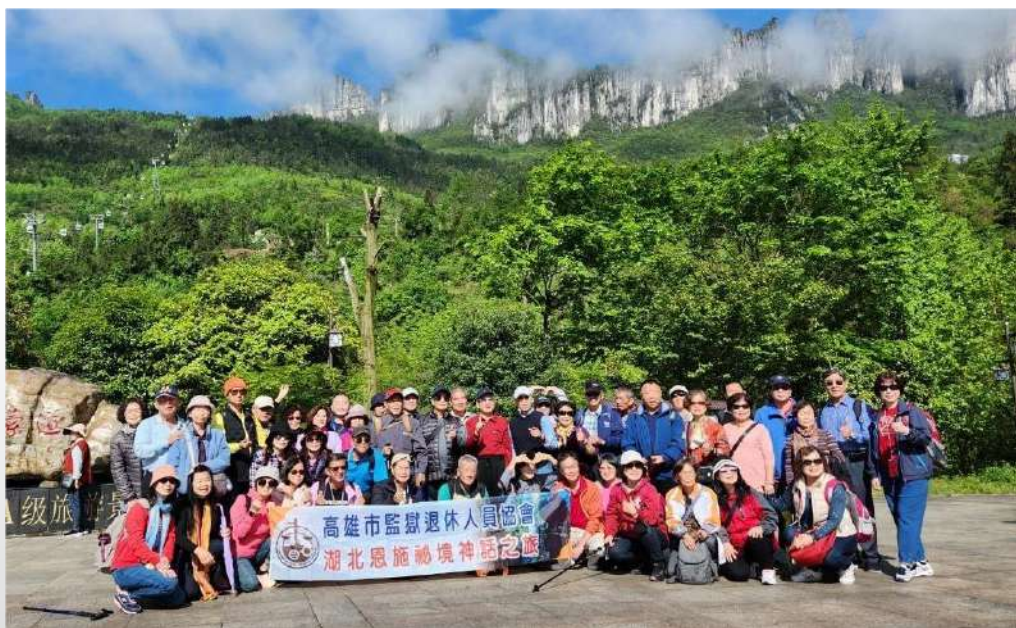
↑ .恩施大峽谷：湖北武漢恩施大峽谷團體大合照

第三天出發前往世界級水利樞紐工程，國家 5A 級景區～「三峽大壩」參觀，參觀時間約 3 至 4 個小時。三峽大壩是全世界最大的水利工程，來到了此處，大家陸續的登上壇子嶺。壇子嶺是三峽大壩工程的至高點，也是觀賞三峽工程浩瀚雄偉全景的最佳位置。離開三峽大壩風景區，退休協會會員及顧問，在風景區出口處拍了一張大合照。