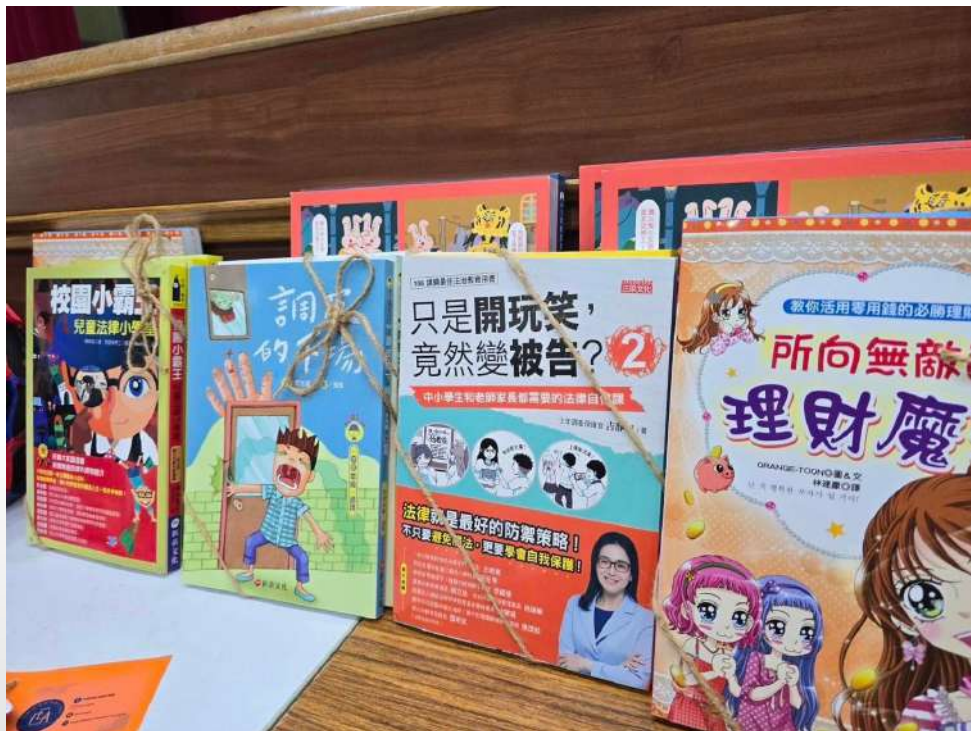
↑ . 中華民國犯罪矯正協會贈水上國小法律書籍

活動結束後，獲得校長、老師跟學生的一致好評，中華民國犯罪矯正協會未來將持續推動相關的法治教育宣導活動，幫助更多民眾了解法律的重要性，並倡導維護社會秩序的價值觀，透過與學校一起努力，建立更安全的社會及學習環境。