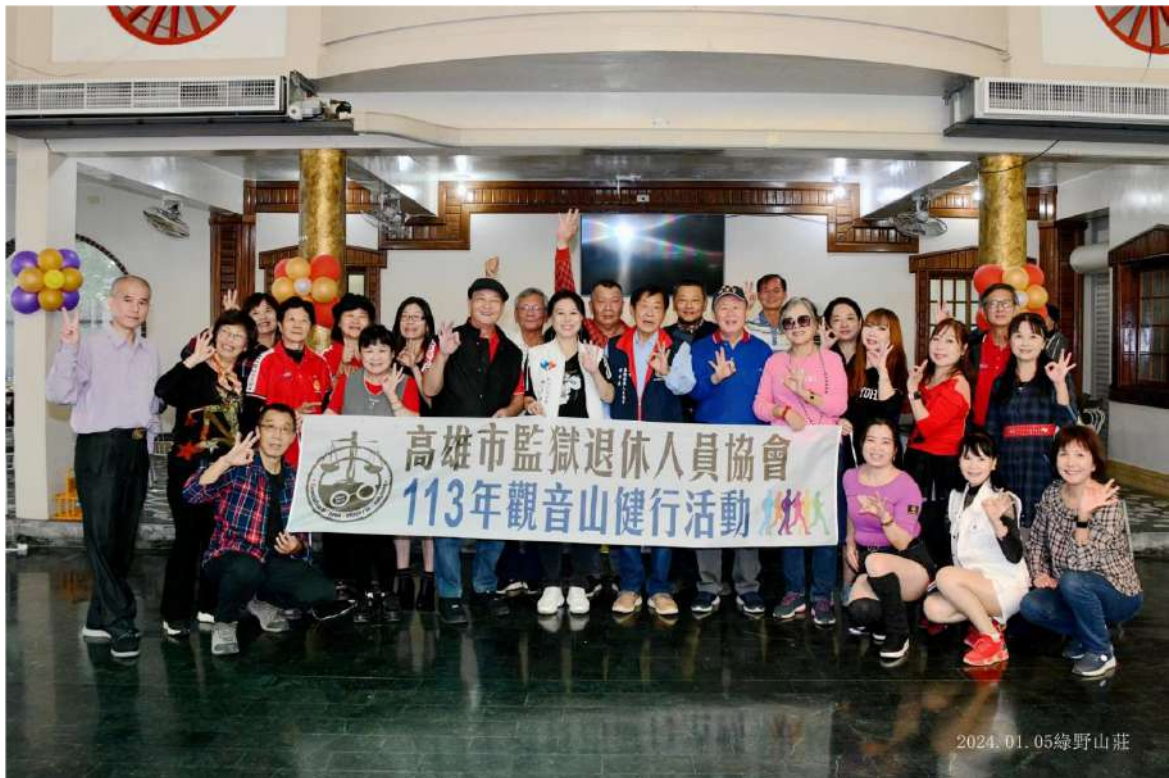
↑.觀音山健行活動土雞城餐廳大合照

上午9點半，協會會員、顧問，陸續於觀音山石碑後方50公尺處【翠屏幽靜牌樓】右方停車場集合處報到。報到時，每人領取一瓶礦泉水後，各自結伴開始了今天的健行活動。