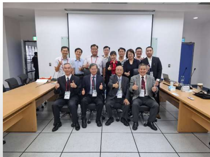
↑ . 刑事政策課程