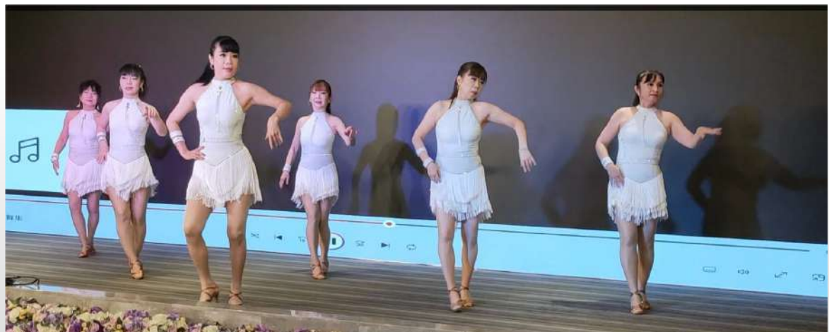
↑.高雄市靖舞藝術舞集舞蹈表演