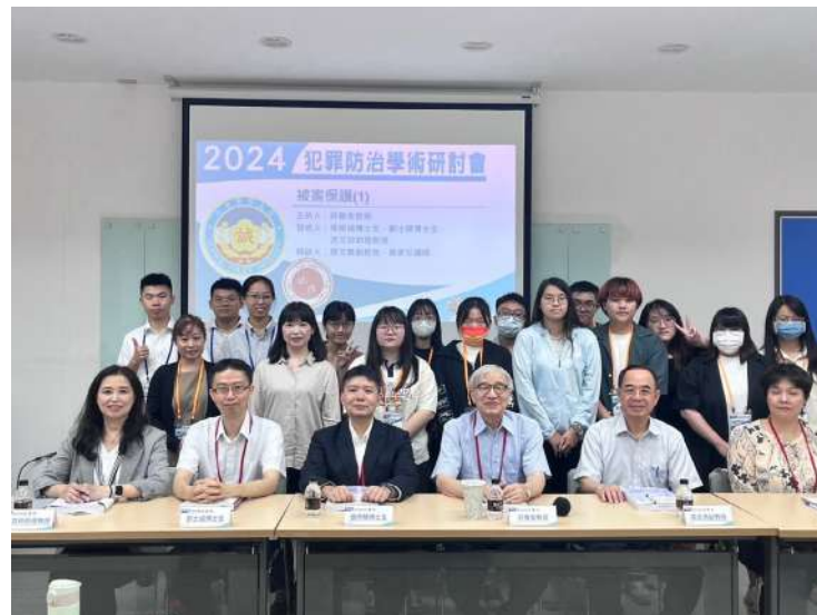
↑ . 被害保護課程