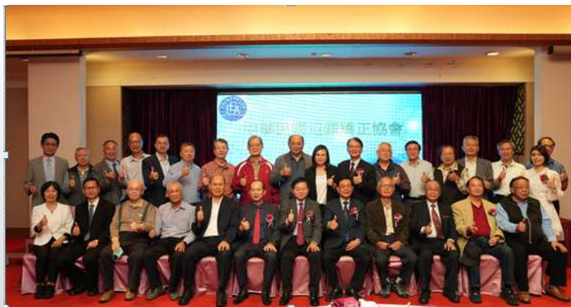
↑ .2024.02.23 於臺南市「總理大餐廳」交接後大合照留影紀念。