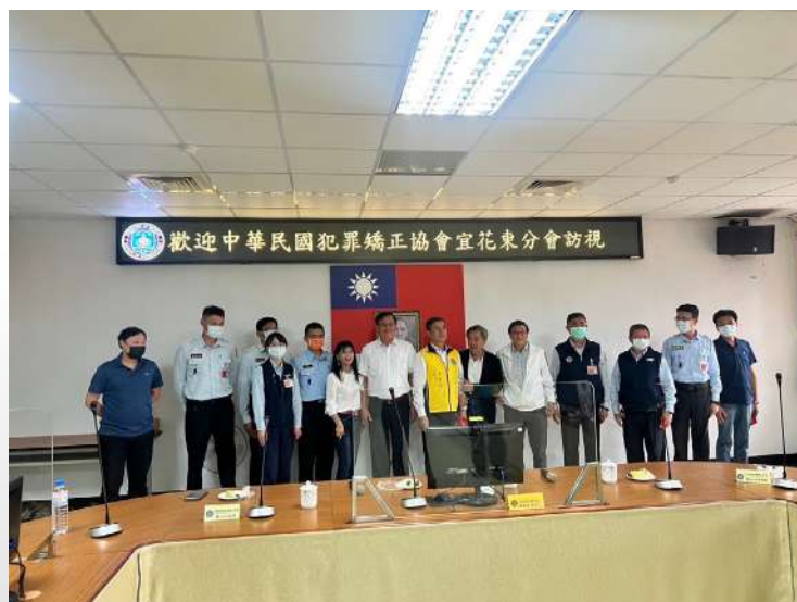
↑.宜花東分會主任委員吳吉成到東成監獄頒發績優人員獎金