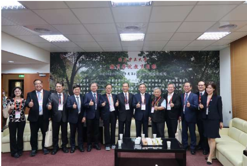
↑ .活動開始前的大合照

中華民國犯罪矯正協會也會盡最大的力量，與大家站在同一陣線，為創造一個無毒的社會而奮鬥。