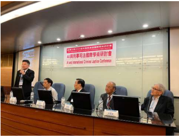
↑ . 專家、學者及實務工作者互相激盪研討

透過專家、學者及實務工作者的互相激盪研討，來了解 AI 技術應用於刑事司法制度的優缺點；結合刑事司法學、法學、社會學、資訊學，跨領域合作，擴大 AI 技術的應用範圍及深度；培養研究生學術研究的能力，增強國內未來學術研究的量能！活動圓滿成功，獲得一致好評！