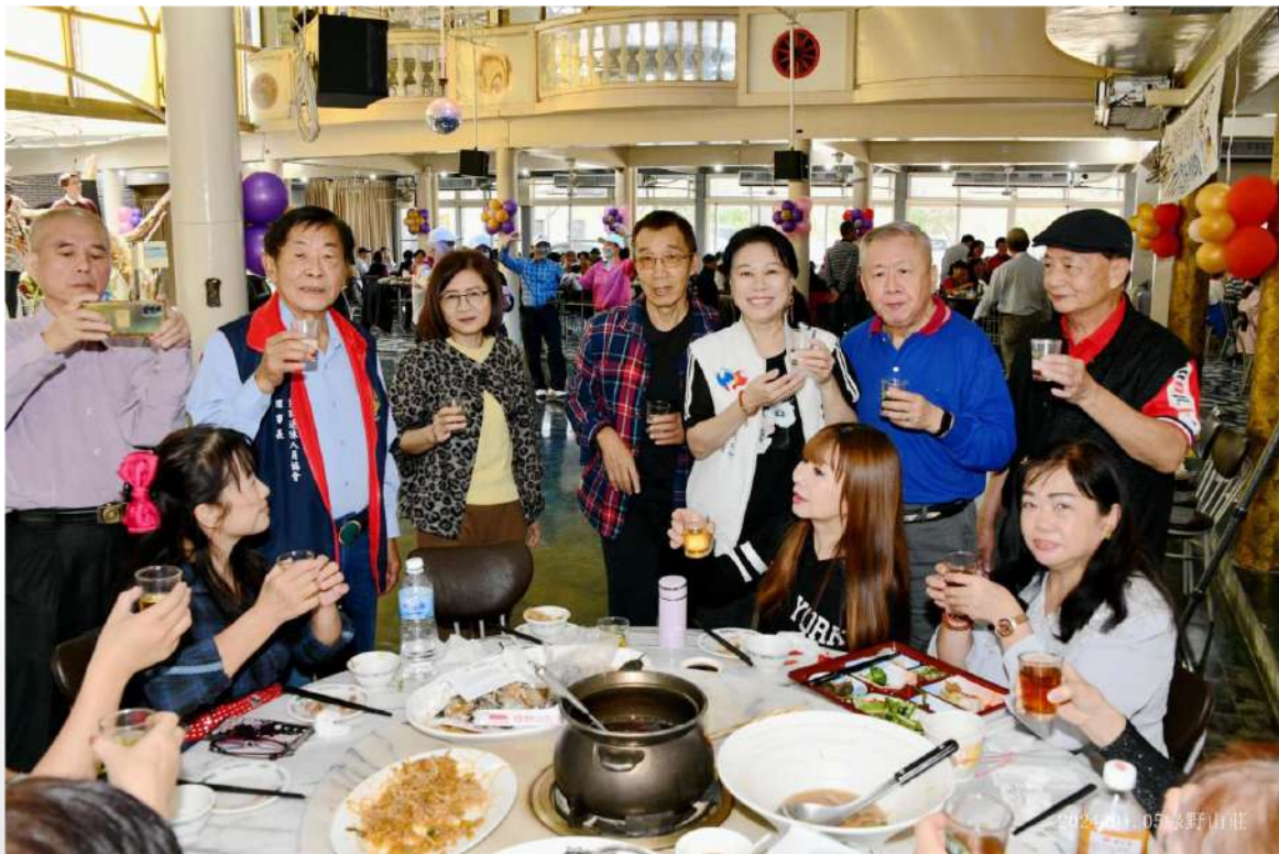
↑. 理事長、吳創會長、陳前會長舉杯跟會員敬酒

活動結束前，廖理事長在台上高歌一曲後，勉勵大家常出來戶外接近大自然，多走路運動，把身體顧好。新的一年到來！祝福大家：闔家幸福平安，身體安康。回程時，請大家注意行車安全，期待春酒再聚會。