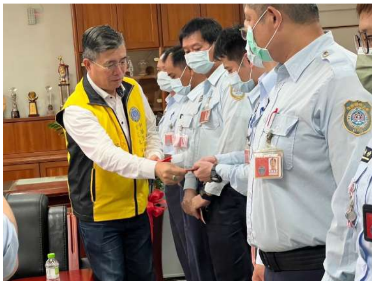
↑. 宜花東分會主任委員吳吉成到臺東監獄頒發績優人員獎金