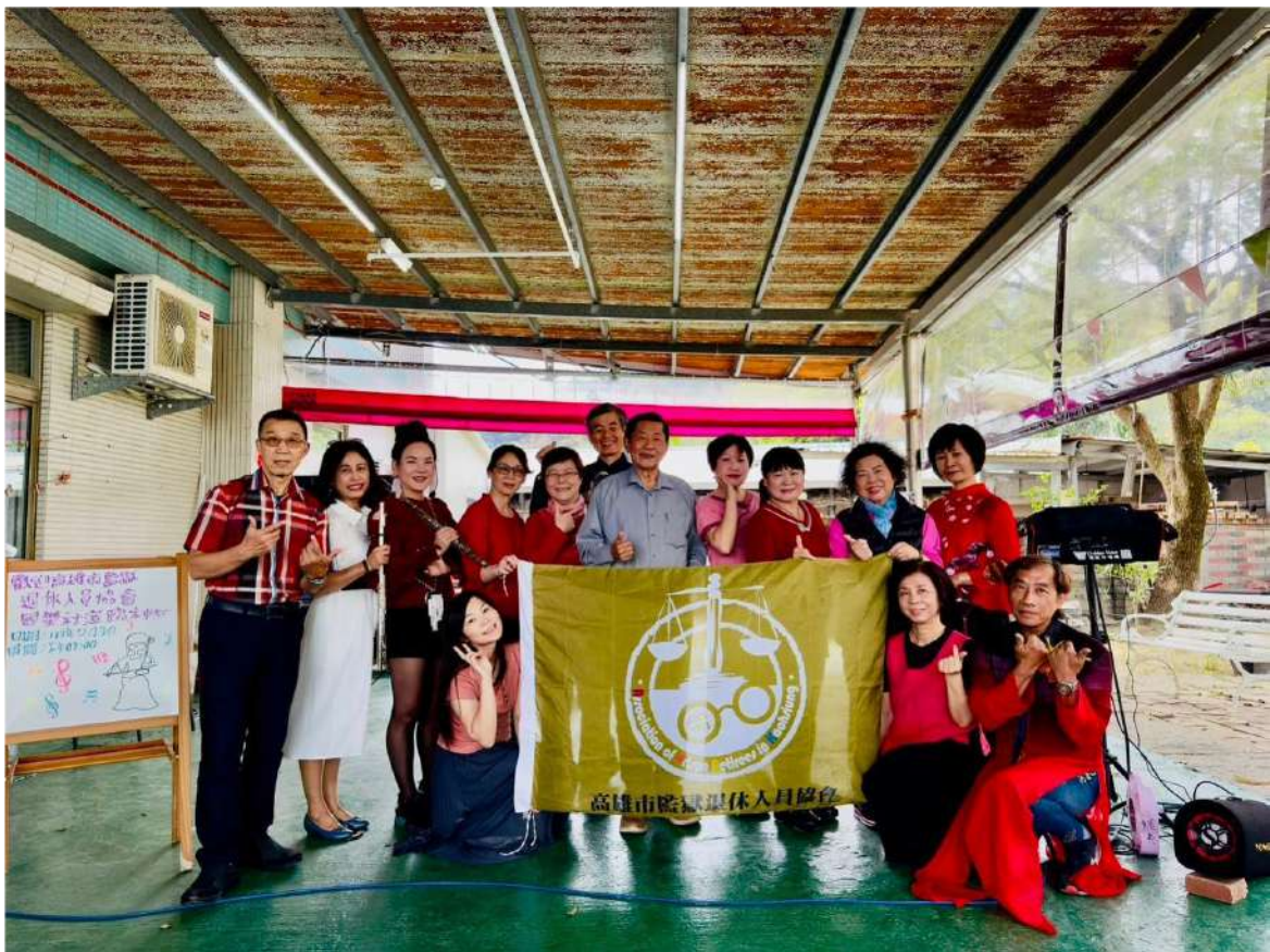
↑.春節關懷慰問活動表演人員大合照

為迎接新年的到來，「高雄市監獄退休人員協會」於113年2月3號（星期六）下午14時，在協會廖理事長的帶領下，前往旗山（合信興養護機構），辦理了一場春節音樂聯歡會。