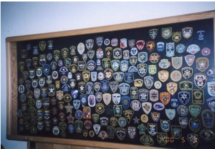
2000年5月2日參訪美國紐約市 矯正人員訓練所之教室走廊，吊 掛櫥窗，擺滿了全美各警察與監 所管理員之臂章樣式。 圖二