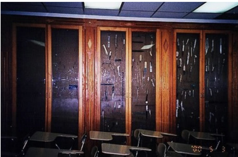
2000年5月3日參訪美國紐約中國 城附近的「紐曼頓監獄」在「常年 教育」教室櫥窗，擺置各式安全檢 查搜出收容人自製金屬凶器。 圖三