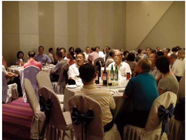
獨樂樂不如眾樂樂，矯正機關退休同仁相聚一堂，敘離情、話家常。

中部矯正同仁退休協會，為願年年，矯正同仁家團圓。頃於中秋節前，即今年(2015)九月十三日星期日中午十二時，於台中市南屯區永春路17-8號「福野婚宴館」舉行矯正退休同仁聯誼聚餐活動。