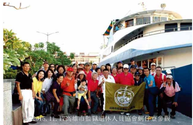
輪船於「蚵仔寮漁港」靠岸，矯正工作退休同仁於碼頭合照