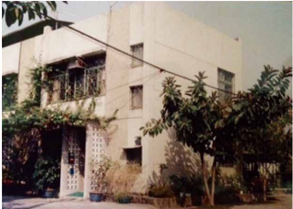
圖八 高雄監獄宿舍為現代化之二層樓房