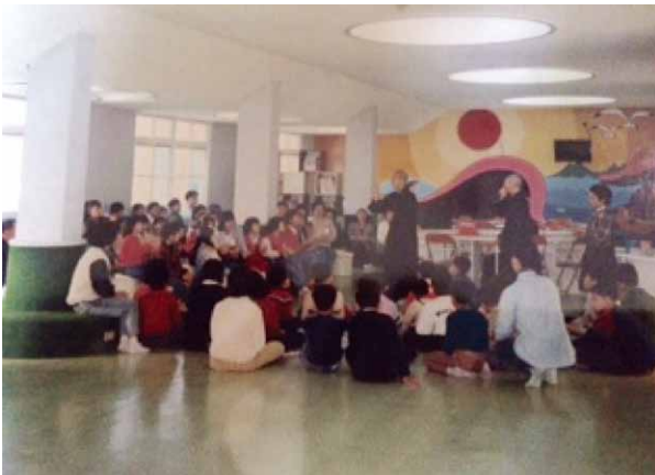
圖十三 作者帶領宿舍社區兒童至佛光山參觀