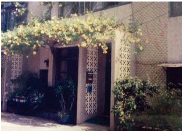
圖七 民國74年搬家至高雄監獄宿舍

高雄的這一站，是我宿舍人生裡，最沒有留白的黃金歲月。因為親近佛光山的因緣，加上此區住戶甚多，小孩便成了此社區的主要風景，宿舍區有活動中心，所以，在因緣聚合、水到渠成之下，我充當義工帶著社區兒童成立了「唸佛班」「繪畫班」「說故事班」和宿舍區媽媽們，則玩起「健美班」「插花班」，