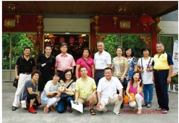
圖二、矯正工作退休同仁報到合影