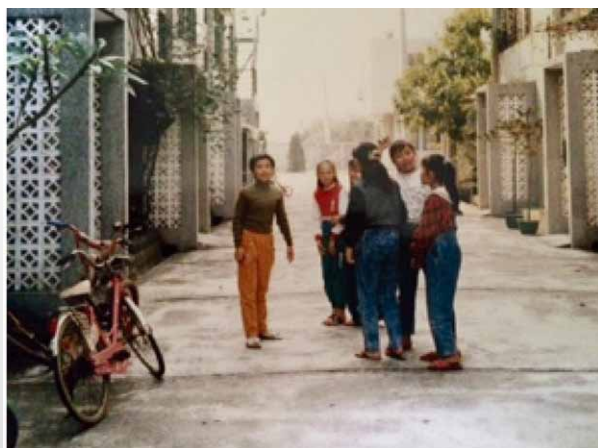
圖九 高雄監獄宿舍門前寬廣，孩童們穿梭各棟列之間