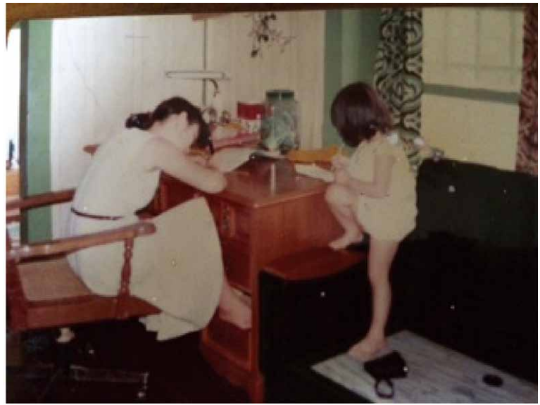
圖三 沒有PC和手機的年代，只能勤寫家書，母女於花監宿舍內

為有女主人，變成了最佳廚房。那一次是我人生中第一次面對張牙舞爪的龍蝦，既生猛又兇惡的樣子，令我心驚膽顫，真不知從何下手，最後，也沒沖洗直接丟到滾水中，聽到龍蝦掙扎的聲音，感覺自己有如犯了下地獄的死罪一樣，不斷唸阿彌陀佛。如今，這記憶一經挖出，依舊歷歷在目。