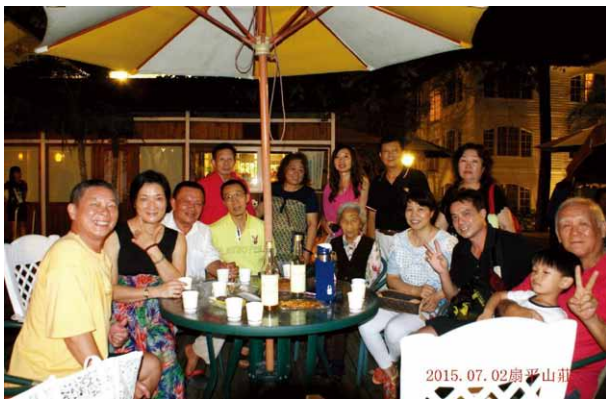
圖三、晚餐後退休同仁，泡茶敘舊