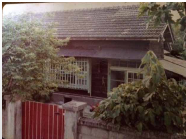
圖二 花蓮監獄宿舍之大門，日式房屋併庭院有50坪