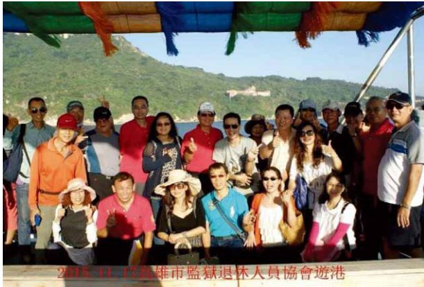
退休同仁搭上「高雄輪」合照留念