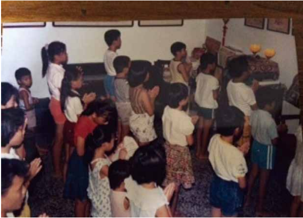
圖十一 作者在高雄監獄宿舍自宅內客廳設兒童念佛班一景