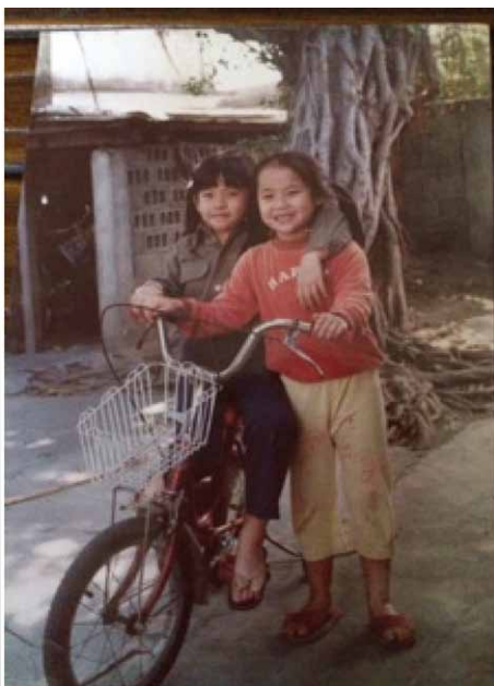
圖四 民國72年攝於台東宿舍庭院 當年的小女孩們今已為人母

此站，外子由台中監獄教誨師奉調升至台東監獄調查科長，分配住進經多次改造過的日式平房，加建搭蓋，混搭建材之下，已失去原來的日式風格。格局不正，客廳卻不小，正對著兩間臥室，說到此，也有難忘的畫面。因為，家中有一台錄放影機，外子常招呼一票學長學弟來宿舍中看租片，當然看官們知道的食色性也有時候，他們也對AV女優，有些兒好奇，少不得，大家共享眼福嘛，但是，良家婦女焉有同樂之理，所以，這個時候，我就會和孩子「避居」臥室，表現出