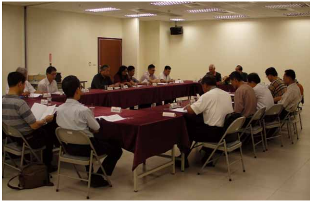
圖一 台南分會委員與新聘顧問出席會議