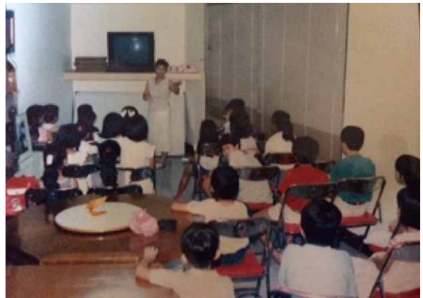
圖十四 作者於宿舍區活動中心教室開「說故事班」正在向社區兒童說故事