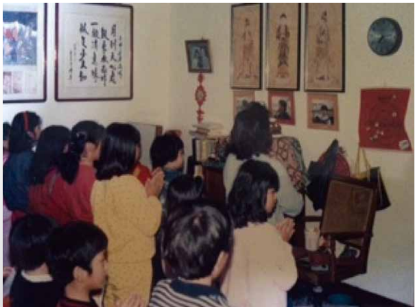
圖十 作者在高雄監獄宿舍自宅內客廳設宿舍區兒童唸佛班