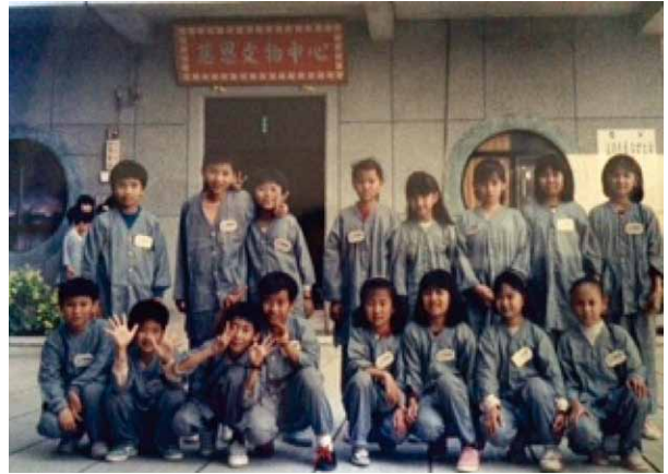
圖十二 作者帶領宿舍社區兒童至屏東佳冬鄉慈恩寺參加佛七活動