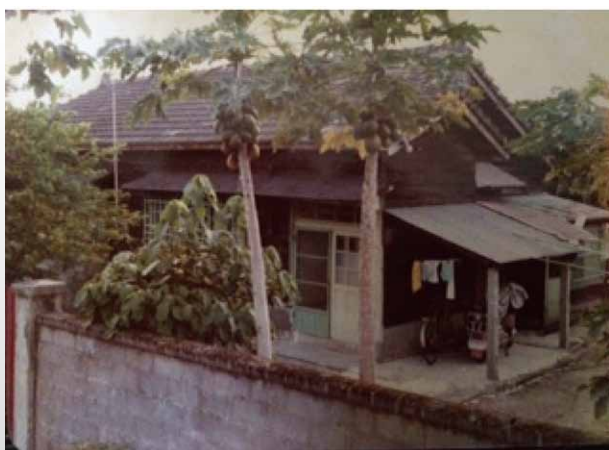
圖一 民國68年首站居住之花蓮監獄宿舍

在花蓮宿舍最難忘的事是；有一次某學弟的朋友，送他好多尾活蹦亂跳的龍蝦，因為一票學弟都是單身漢，不然就是隻身赴任的，所以理所當然，我家因