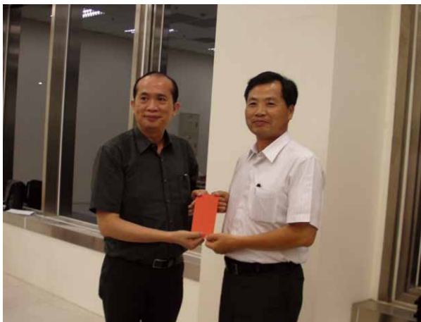
圖五 曾分會長致贈明德外役監慰問金10萬元，辛典獄長代表接受