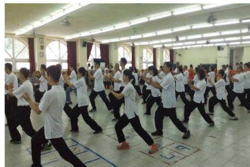
太極拳社與其他社團表演宇德太極拳

有時候太極拳前輩，如不發勁外顯功夫給入門者見識，似乎不容易令人相信其所言為真，甚至引發學習動機，自己也是歷經這樣的階段，但張三丰祖師在其太極拳論卻說：欲天下豪傑，延年益壽，不徒作技藝之末也。可見一般世人所愛是讓外在的招式或防身制敵運用的技藝，事實上它的價值也在於延年益壽，甚至變化氣質，提高人生境界。練拳最高境界是從心所欲，防身攻擊自不在話下，最重要是養生，這也是兼顧工作及健康的最佳選擇。自己的更大收穫是心性提升，但說了這麼多，可能會令人誤解太極拳功夫高深，難以入門，其實不然，套用陳老師常說的：專心就健康了。入門者只要有誠意，專心練，就能達到養生目的，再來就是熊老師提到的，功夫深淺如同提煉物質，要達到什麼樣的精純度，就看個人修行，像老師縱使練到很高的精純度，仍然是每天勤練，偶有身體不適，都能自行調養自癒，對自身非常了解，靈敏度非常高 4 。