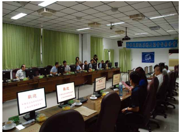
圖二 分會假高雄二監會議室召開委員會