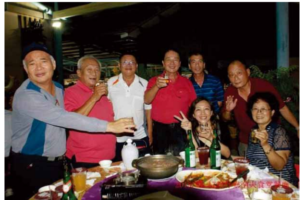
享用海鮮大餐，互相敬酒，互祝萬事如意，其樂淘淘，一切盡在不言中

生活世界，凡到此一遊者，身心鬆弛了下來，心情也跟著悠然自在，整個生活步調都被放慢下來了。