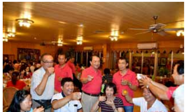
吳理事長、邱前所長、夏總幹事聯袂敬酒