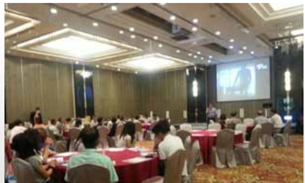
卸任前之方光復會長報告一年來之會務情況