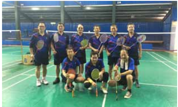
「以球會友」的退休同仁