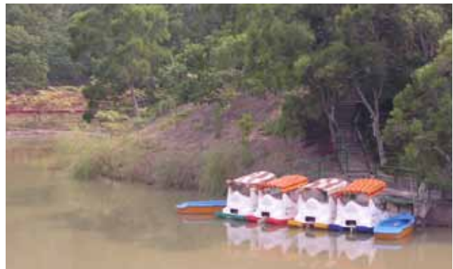
明德山莊之「淨心湖」