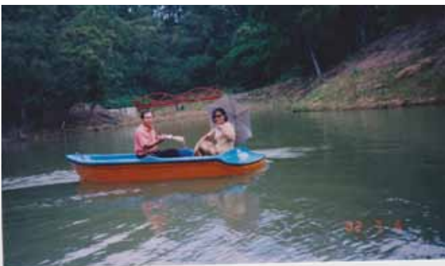
明德山莊內之湖泊