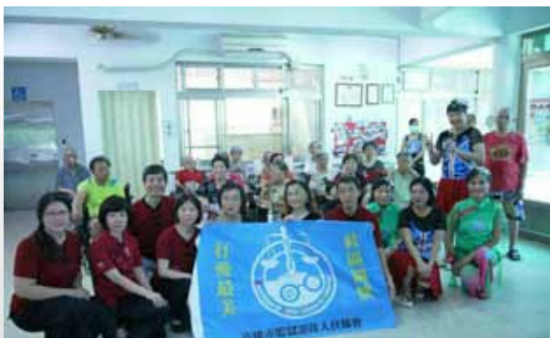
社區關懷，有愛最美

該協會成立了羽毛球隊後，退休會員多了聯誼及運動機會，促使會員退休後生活，過得更燦爛精彩，身體也愈加健康，致其長期有恆心與毅力之運動，個個猶仍是生龍活虎，精力充沛。