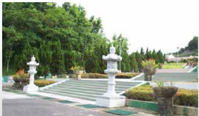
明德外役監行政區前斜坡臺階耳目一新。