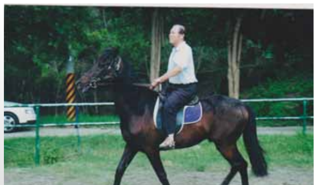
明德山莊增置馬場