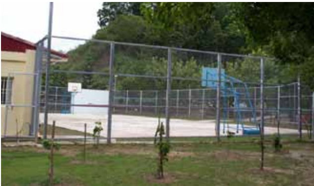
收容人暨員工籃球場及網球場。