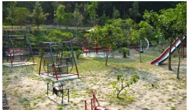
開闢兒童區供懇親小朋友遊戲空間。