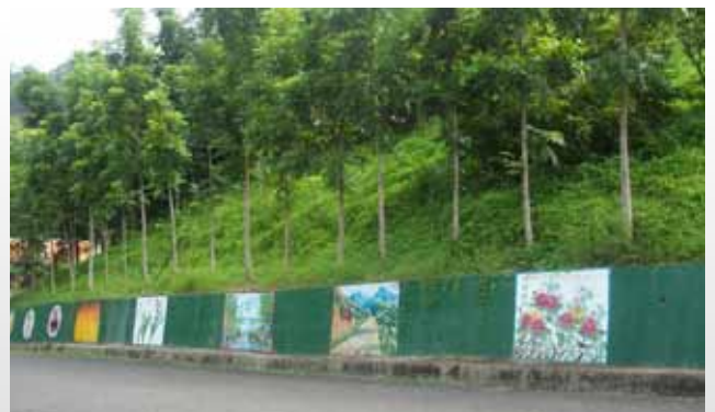
山地斜坡分批造林及美化。