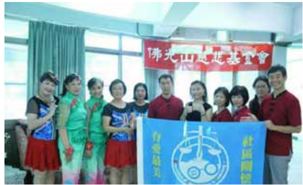
高雄退休協會同仁，愛心永長留

炙熱的氣候，汗濕了該會志工們身上不透氣的唐服，卻澆不熄他們滿滿的慈悲心。一群來自高雄市監獄退休人員協會志工們，遂於2016年7月3日（星期日）下午，首次與佛光山志工團隊合作，連袂前往位於鳳山區的青圓長青照護中心，關懷慰問院內的長輩老人們，誠所謂「老吾老以及人之老」也。