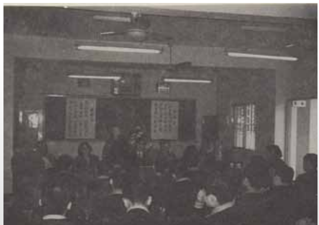
臺東監獄受刑人佛學營活動。