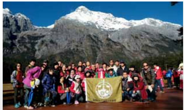
會員留影於大陸昆明麗江玉龍雪山