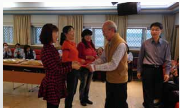
桃園女子監獄黃典獄長與進修獎學金得獎人