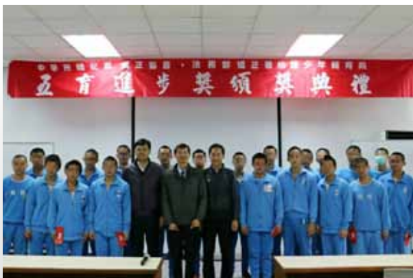
桃園少輔院院長、秘書及本會秘書長合影