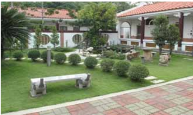
粉刷、綠化、美化的明德山莊

筆者為上揭塑造明德外役監獄各項景觀與休閒設施，意在兼扮演「明德山莊」類似「警光山莊」之角色，已發揮預期效果；乃當時之矯正司為疏解戒護人員之工作壓力，即於此處，每半年辦一期，每期50人之戒護工作人員「壓力調適