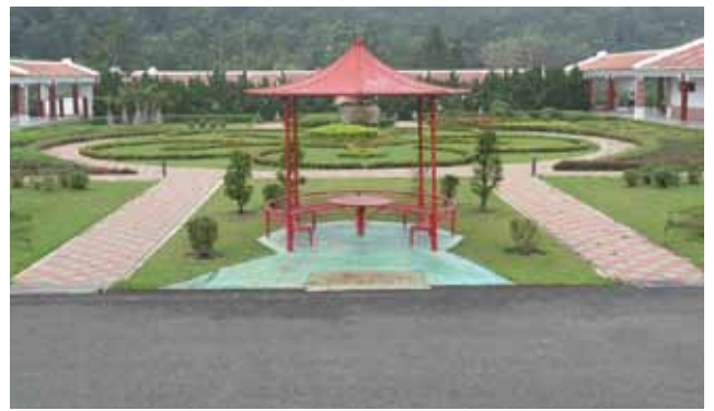
收容人接見室前，美輪美奐的涼亭花園。