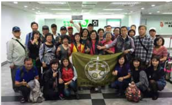
退休協會赴大陸昆明出發前，機場留影