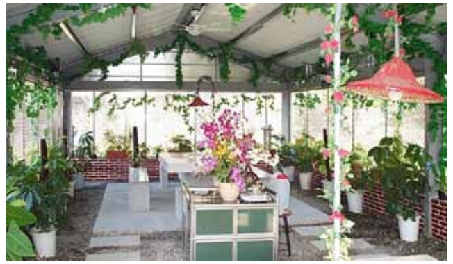
諮商輔導室優雅的佈置