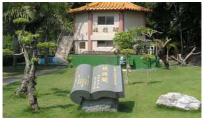
藏經閣經費共95萬元由善心人士捐助

筆者有感於全國七仟人左右之矯正工作同仁，於高高圍牆內，守著陽光、守著歲月，終日汲汲忙忙與收容人為伍，備極辛勞。而於警察界，全國各地風景區，到處設有警察山莊供予落腳休閒，而矯正界實有不足。該監既有14間招待所，嗣經著手加以環境美化，然尚缺乏各項休閒設施，既然有湖光山色，大自然美景，何不增加誘因，兼扮演供獄政人員休閒使用之「明德山莊」角色？惟「政府財力有限，社會資源無窮」，「德不孤，必有鄰」，遂復多方透過社會資源，配合部份經費，分別完成下揭設施：