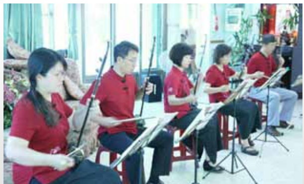
同仁表演二胡樂聲，觸動老人內心世界