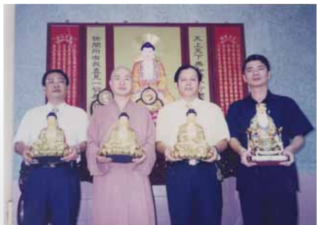
東成技訓所運用社會資源成立佛堂

筆者忝任矯正機關首長10年，首站於1997年08月11日，由臺中監獄副典獄長調升花蓮看守所所長，迄1998年07月14日再奉調升至東成技能訓練所簡任所長，復承做督導完成該所第二期宿舍區工程暨污水處理場工程。旋續修繕該所「受感訓處分人技訓專區」，另設置該所員工K T V室供以疏解工作壓力及應用社會資源設立宿舍區佛堂及涼亭一座，同時於該宿舍