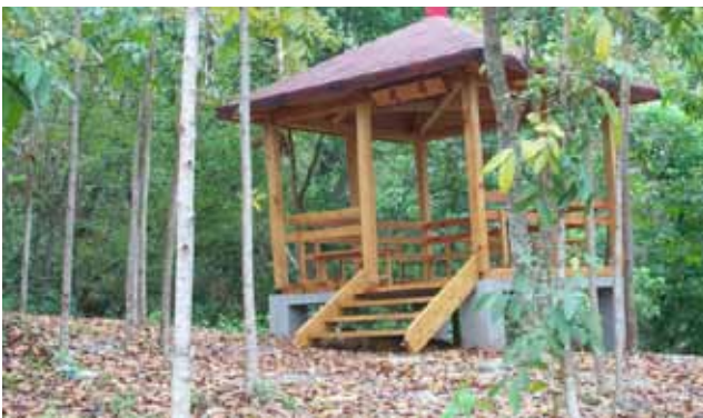
明德山莊內木製涼亭