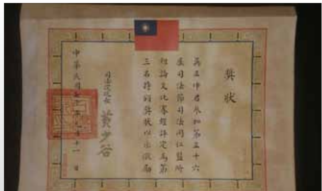
全國司法節論文比賽獲頒第三名。

另溯自1980年7月1日起，我國司法體系邁向另一新境界；即高等法院以下之各級法院於行政系統上改隸於「司法院」；行政院「司法行政部」，則改稱「法務部」，掌理檢察、監所、司法更生保護及法律事務，使司法革新工作更上一層樓。時筆者有鑑於我國犯罪矯正工作於扮演刑事司法體系中之重要性，即於是年參加由司法院所舉辦之「司法節」全國論文比賽，以「從審檢分隸談如何改進監所業務」為題，於司法界各方菁英參角逐中，僥倖榮