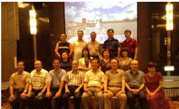
參與聯誼活動退休同仁合照留念。