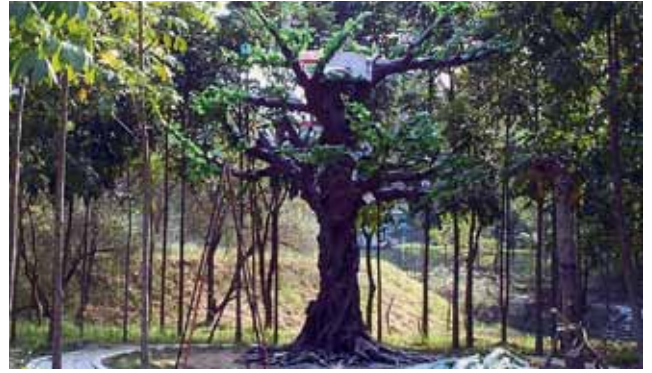
明德外役監人造「鳥巢懇親大樹」