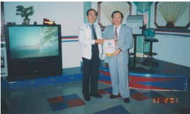
「明德山莊」供矯正工作人員使用