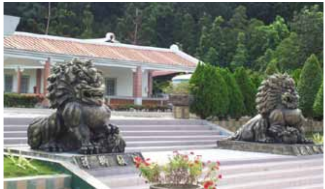
明德外役監受刑人自製一對「祥獅現瑞」。

爰經高雄名地理師梅峰榮老師現場會勘，選擇該監依山臨水之湖畔吉地興建，所謂「眾志成城」，此全國首座「監獄佛寺」，佔地45建坪之「明德佛堂」，自2001年5月1日起興建，歷經四個月餘，耗資二百餘萬元，終告竣工。又該監地處偏遠山區，佛教出家法師蒞監宏法，諸多不便，「工欲善其事，必先利其器」乃復透過社會資源，籌建出家法師蒞監長駐之寮房暨藏經閣，不必使之每日遠途來回跋涉山區。