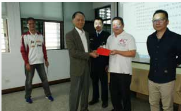
花蓮看守所彭所長與進修獎學金得獎同仁