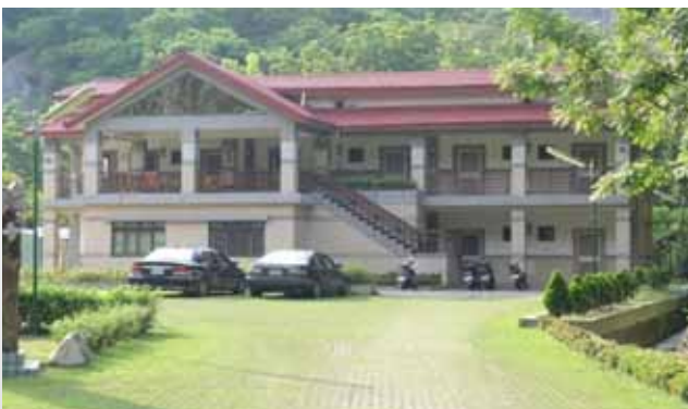
原替代役男宿舍區（現為收容人懇親宿舍）。