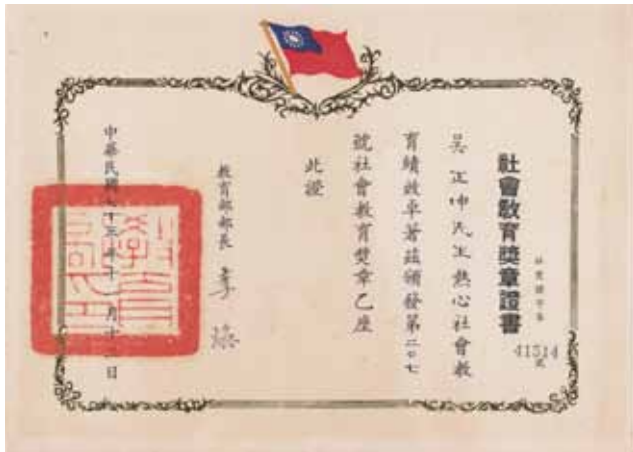
教育部頒發「社會教育」獎章證書

刻，遂遴選臺東監獄為法務部之受獎團體代表，而筆者雖是協辦人，但從策劃、執行，一以貫之，順理成章被遴評為個人受獎對象。1984年11月12日國父誕辰紀念日，筆者遂北上臺北「國父紀念館」參加紀念大會，接受教育部李煥部長頒獎表揚(證書如下圖)。