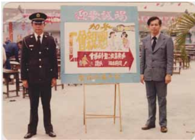
1980年筆者(圖右)任臺中監獄教誨師