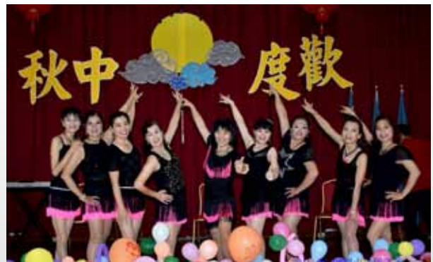
「以舞會友」，歡度中秋