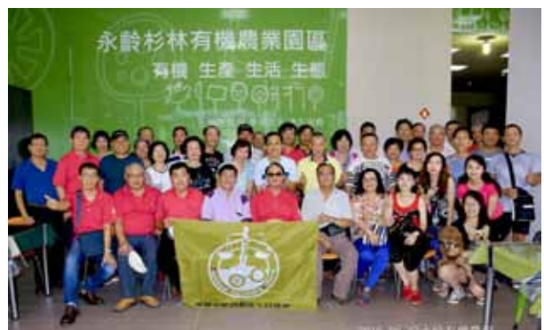
退休協會於高雄「永齡杉林有機農業園區」參觀