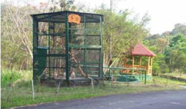
「明德山莊」鳥園與涼亭一景。