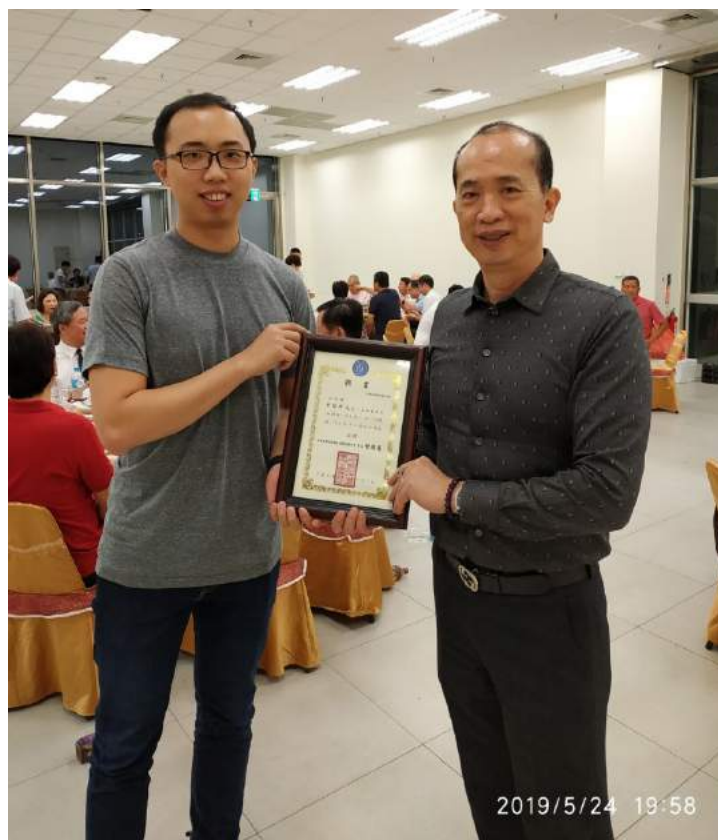
曾會長國展頒發予新加入委員聘任證書。

夫以監、所犯罪矯治工作之神聖使命，也是「社會工作」的一環，因為從事獄政工作同仁，於人力短缺之下；他（她）們平時默默的耕耘，朝夕與這些「社會邊緣人」相處，作之師、作之君，試圖化莠為良，改變囹圄之身的收容人，有教無類，期使重新適應社會生活，工作精神可嘉。