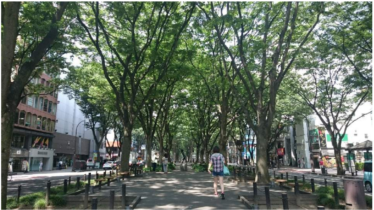
日本仙台市區一景

最後，對於有希望前往日本留學的人，想提供一點心得參考。前面雖然提到了許多留學準備的問題，例如入學所需知識（日文、專業能力等）的提升，生活經費（自費、獎學金）的準備，還有申請學校的選擇等等。但是這些工作只要即早準備，其實都不會有太大的問題。最大的難關，還是在於是否有決心前往。我在準備的途中，也好幾次遇到挫折萌生放棄的念頭，但最後都是提醒自己莫忘初衷而堅持下來。我相信只要能下定目標積極努力的人，再多的難關都無法阻礙你完成出國留學的夢想。俗話說，天助自助者，願與大家共勉之！