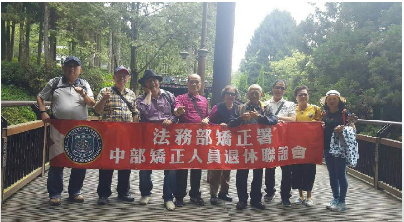
退休同仁於阿里山，讓燦爛陽光曬曬背

其他，於遊覽車上受邀，陸陸續續，亦有許多退休同仁，紛紛告白他（她）們多彩多姿的生活情境，限於篇幅，不再贅述。