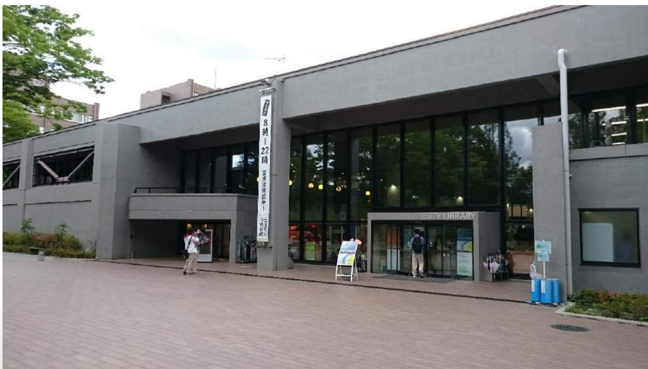
日本東北大學一景

日本各大學院校的研究生申請資格都不同，例如日文檢定等級要求、有無修過相關學分等；審核方式也互異，有的僅需繳交基本資料、研究計畫書即可，有的則需要通過面試、撰寫小論文等步驟。部分學校更有以國籍來制定不同的申請入學制度 4 。因此，在研究各校的制度上，又花了不少時間。