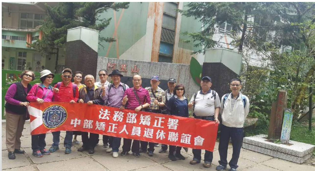
海拔 2195 公尺的阿里山鄉，全國最高之「香林國小」校園前合影。

吊橋旁有一家頗具規模的咖啡店，「阿美」導遊，特別介紹入內，商家可提供免費糕餅、咖啡，退休同仁聞訊，魚貫入內，果真是鼓動腮頰，大吃大嚼糕餅、咖啡，大快朵頤，不亦樂乎？當然，部分同仁於該區，大包小包排隊購買，攜回家裡作兒孫之伴手禮，自不在話下。