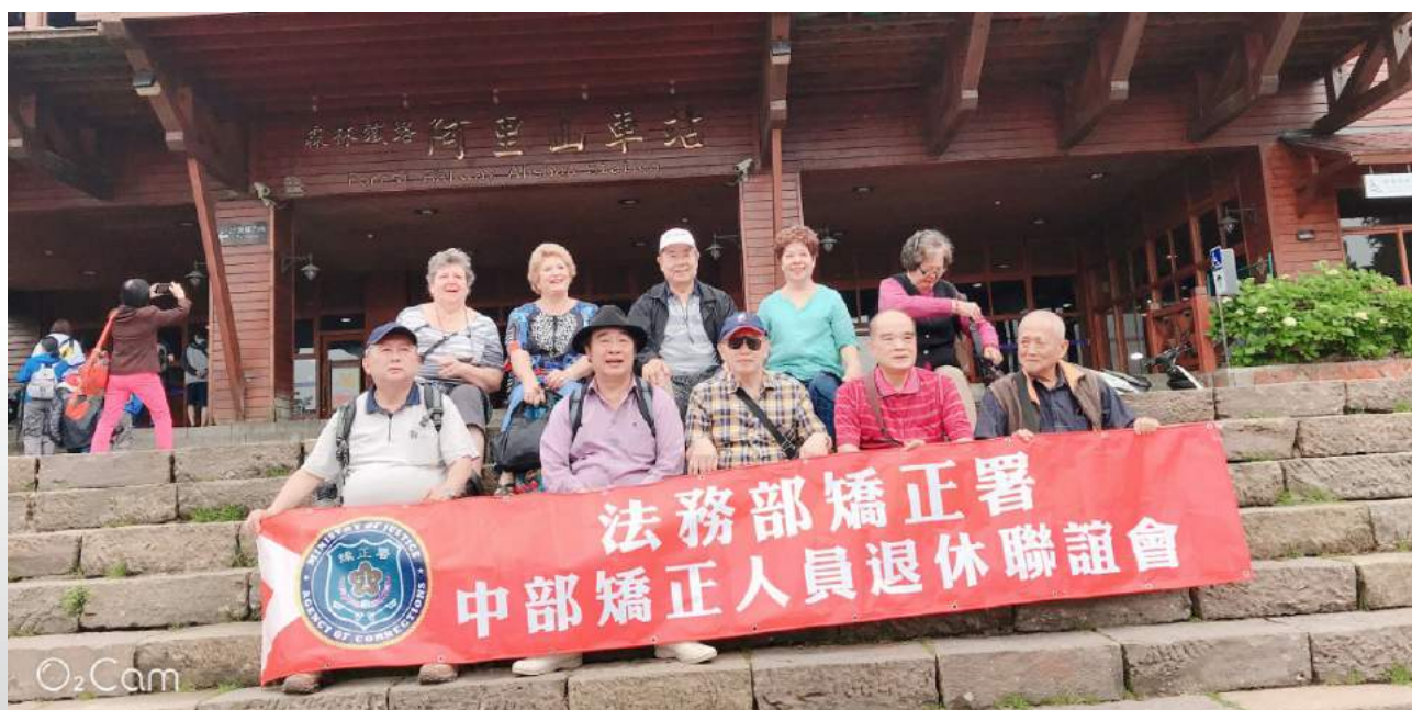
部分退休人員，聯袂於阿里山火車站前合影。

旺萊山—愛情大草原，位於嘉義「番路鄉觸口」，這片草地原本就是觸口牛埔仔草原（愛情絲路），而「愛情大草原」有分成「戶外草原區」和「室內愛情圖書館」，裡面主要就是「旺萊山」相關產品的賣場，像是很受歡迎的「旺萊山」鳳梨酥、鳳梨醋等都能買到，據稱，上午十時才開張，因為我們一行太早到達，錯過享用免費試吃鳳梨酥機會，另外，據云其二樓的咖啡廳，有鬆餅咖啡等輕食可以享用。喜歡拍照的遊客，幾本巨大的立體愛情書造景，也是絕對不能錯過的畫面唷！