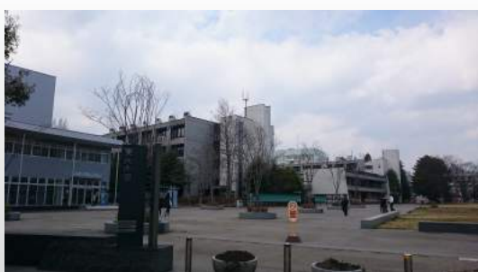
日本東北大學一景

另一項問題則是留學費用。國內有關日本留學的獎學金，除教育部的公費留學考試外，當屬日本台灣交流協會獎學金考試為最大宗。但由於日本「研究生」制度的關係 1 影響教育部獎學金的領取資格，所以我只鎖定交流協會獎學金準備。該會的考試是一年舉辦一次 2 ，先通過筆試篩選後，再參加第2階段的面試，筆試科目係依據考生想要留學的專門決定，舉例來說社會科學專門係以日文、數學及綜合科目為主要考科。筆試、面試都通過後即可從「研究生」期間開始領取獎學金。