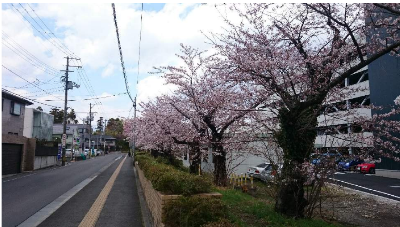
筆者在日本東北大學往返宿舍途中一景

起初，大淵教授收到信後表示願意幫忙，並為我推薦了一位日本矯正實務界出身的教授。我在收到訊息後，相當開心地的準備申請手續，但過不久發現一些情況不符合自己原本的規劃，在幾經思考後，我決定辭退 6 那位教授的指導。在決定的當下，其實內心相當不安。除了對不起該位教授外，在重視學術倫理的日本學界，辭退一位具名望學者的推薦，也是極度不禮貌的行為，很有可能導致從此被拒於日本學界門外。但是，出於對原本留學計畫的期望，我還是堅持我原來的想法。